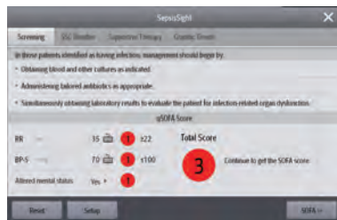
SepsisSight™ Kontrollliste zur Unterstützung bei Screening, Diagnosestellung und Behandlung von septischen Patienten entsprechend den SSC-Leitlinien.