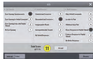
GCS Glasgow Coma Scale. Aufzeichnung des Bewusstseinszustands Ihrer Patienten bei Initial- und Folgebewertungen.