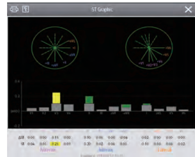
ST Graphic™ Schnelle Bewertung von ST-Segment-Hebungen und -Senkungen.