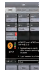
EWS Early Warning Score. Bessere Identifizierung von Patienten, deren physiologischer Zustand schlechter zu werden droht.