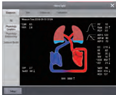
HemoSight™ Verschiedene hämodynamische Hilfsanwendungen helfen bei der klinischen Entscheidungsfindung.

Die BeneVision N-Serie bietet leistungsstarke klinische Hilfsanwendungen (Clinical Assistive Applications; CAAs), die Ihnen dabei helfen, in zeitkritischen Situationen effiziente Entscheidungen zu treffen. Jede CAA ist auf wichtige Herausforderungen zugeschnitten, die bei klinischen Arbeitsabläufen in den unterschiedlichen Abteilungen auftreten.