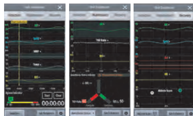
BoA Dashboard™ für eine optimale perioperative Anästhesiekontrolle